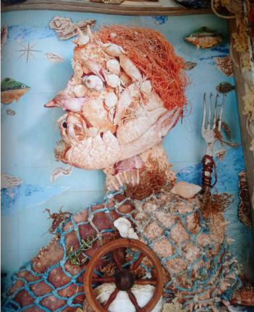
© L'Homme des mers d'Olivier Thiébaud dans Les hommes qui n'en font qu'à leur tête de François David et Olivier Thiébaud

À la manière d'Olivier Thiébaud et d'Arcimboldo dessine ton expérience du repas de la mer en utilisant les aliments comme sur l'illustration et le tableau ci-dessous.